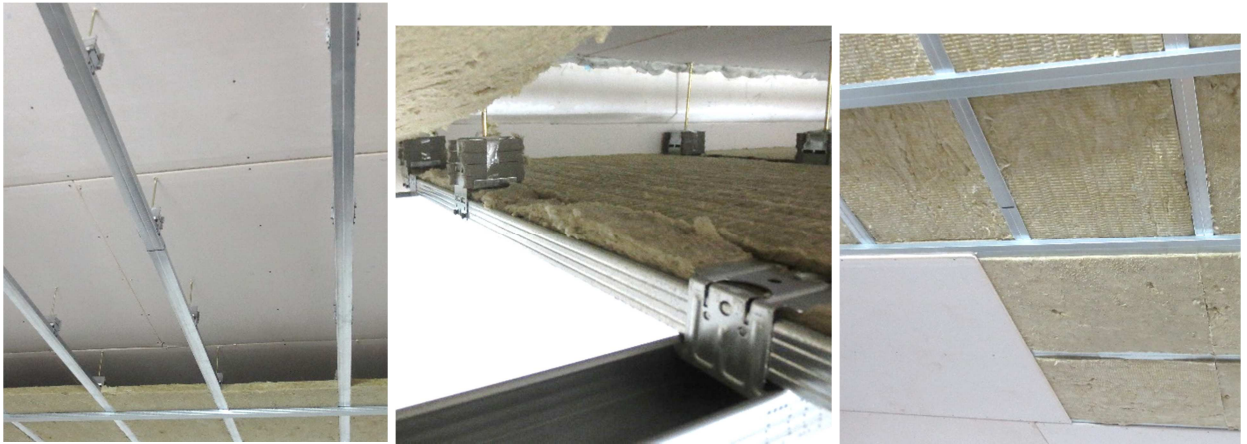
Abbildung A 2.4: Montagesituation mit Unterdecke