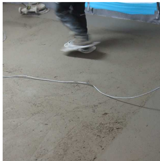
Abbildung A 2.3: Montagesituation Zementestrich