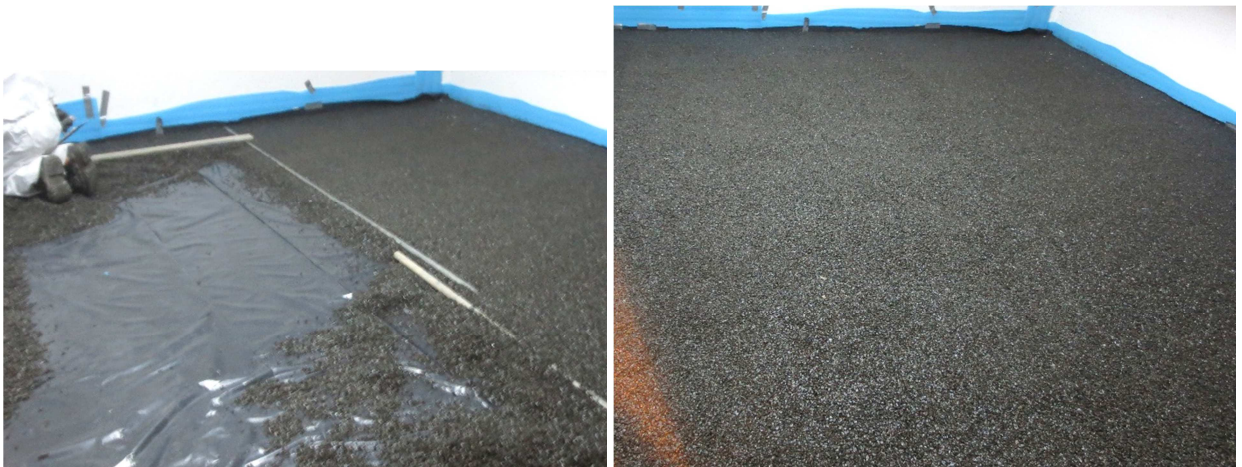
Abbildung A 2.1: Montagesituation – Einbau der Ausgleichs- und Schalldämmschüttung