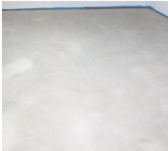
Abbildung A 2.5: Zementestrich (Prüfsituation)