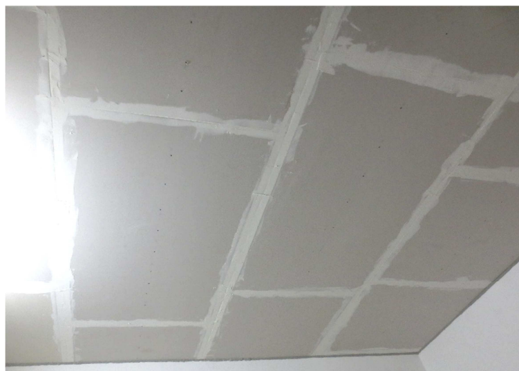
Abbildung A 2.6: Unterdecke (Prüfsituation)